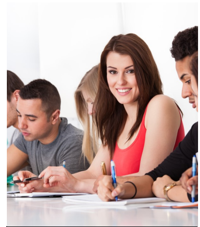
Cours de français