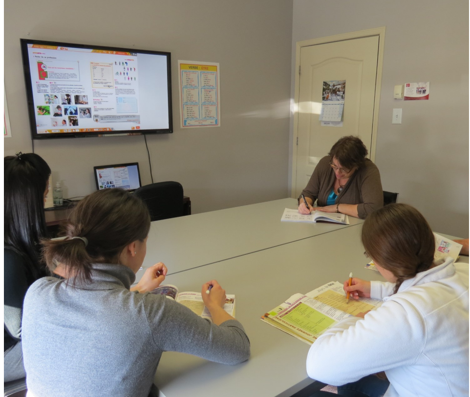
Nos groupes à Brossard

CPMT: Commission des Partenaires du Marché du Travail aux fins de l'application de la Loi favorisant le développement et la reconnaissance des compétences de la main-d'œuvre.