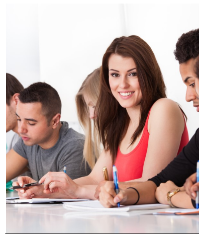
Cours de français