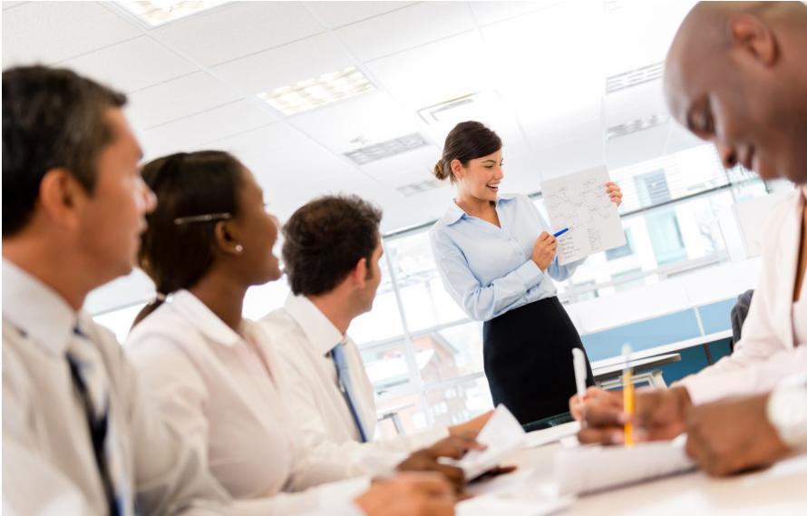
Cours de petits groupes

Au Centre Linguistique Loghati , nous accompagnons et nous formons des professionnels déterminés et motivés qui désirent maîtriser une langue étrangère, afin d'avoir de meilleures opportunités de carrière, d'être plus confiants dans leurs communications et d'avoir plus de facilité à comprendre et parler.